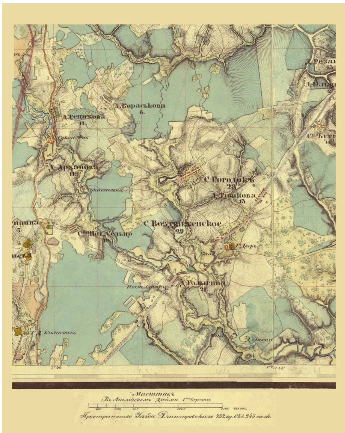
Рис. 7. Район Радонежа по карте: Военная съемка Московской губернии. 1 верста (500 сажен) в дюйме. 1852 и 1853 гг. 135 листов // РГВИА. Ф. 386. Оп. 1; ч. 3. Ед. хр. 3657. Ч. 1–2. Ряд IV. Листы 12 и 13