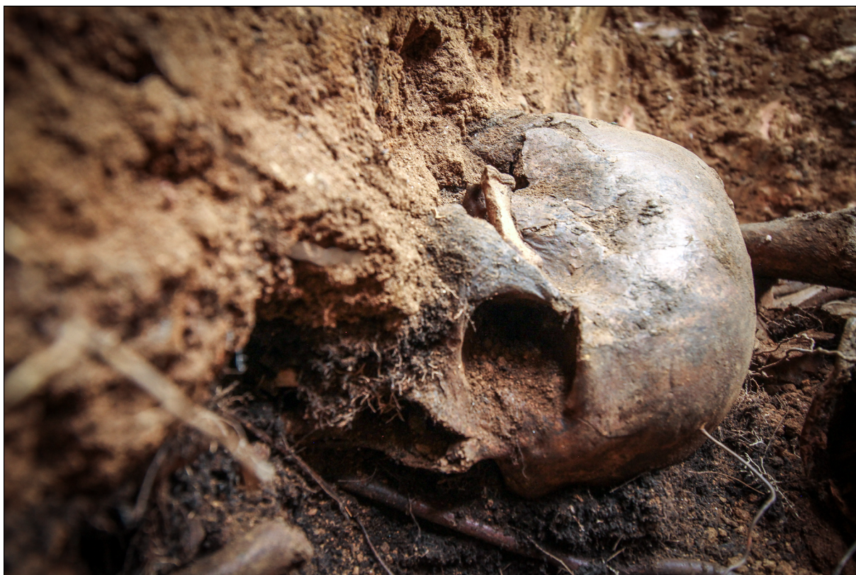
Рис. 17. Вид на антропологический материал, зафиксированный в южной части зоны массовых захоронений в 2022 г.