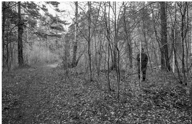
Рис. 2. Вид на сохранившееся основание бани комплекса хозяйственных построек испытательного полигона НКВД 1930–1950-х гг.

13 метров от шурфа № 45 по направлению на запад и в 19 метрах от шурфа № 23 по направлению на северо-запад. Вход в землянку фиксируется с востока. Уровень дна фиксируемой ямы от дневной поверхности составляет 0,93 метра.