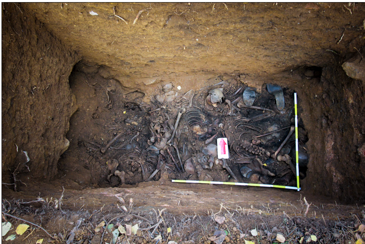
Рис. 16. Вид археологического шурфа с антропологическим материалом в зоне массовых захоронений