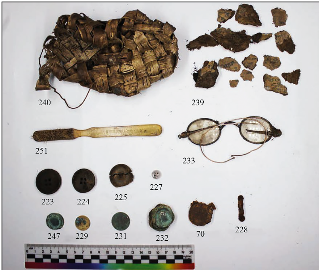
Рис. 14. Вещевой материал из коллекции, собранной при археологических изысканиях в районе Мемориального комплекса 2022 г.