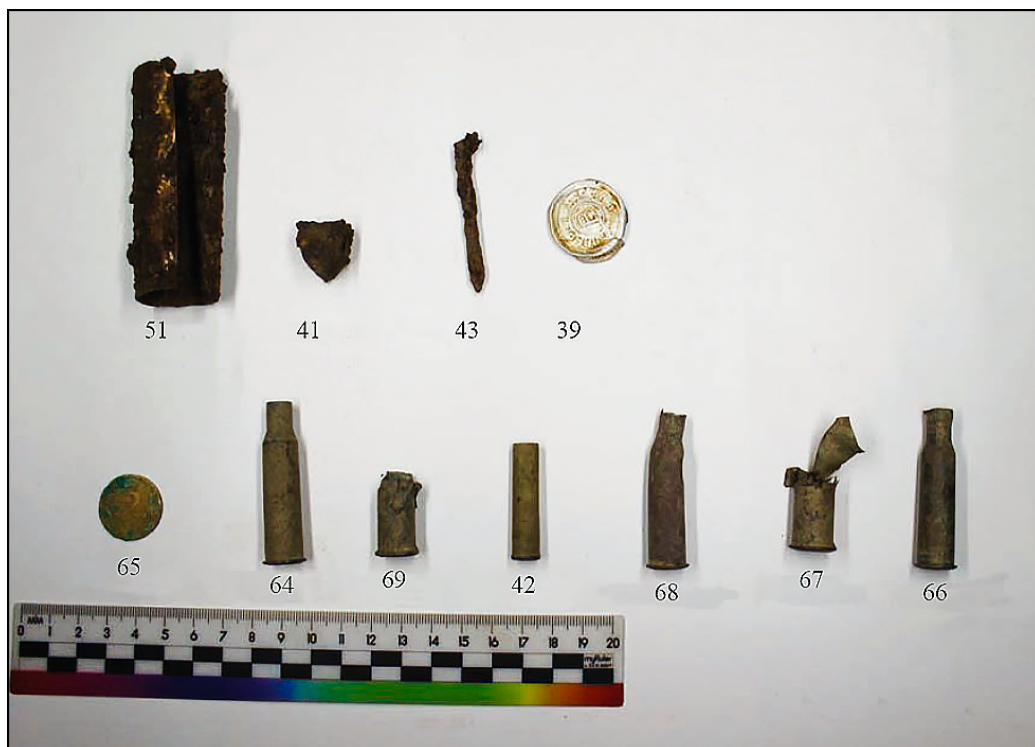
Рис. 15. Вещевой материал из коллекции, собранной при археологических изысканиях в районе Мемориального комплекса 2022 г.