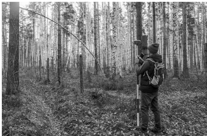
Рис. 1. Вид на сохранившийся фрагмент ограждения периметра испытательного полигона НКВД 1930–1950-х гг.

из четырех секций сохранился в районе разминочной площадки биатлонного стрельбища «Динамо» (центральной части бывшего испытательного полигона НКВД).