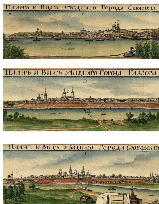
Рис. 12. Виды уездных городов Вятской губернии Сарапула, Глазова и Слободского с Генеральной карты Вятской губернии 1806 г. Fig. 12. Views of the uyezd towns of the Vyatka province — Sarapul, Glazov and Slobodskoy — from the General map of the Vyatka province, 1806