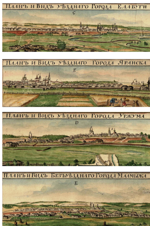
Рис. 14. Виды уездных городов Вятской губернии Елабуги, Яранска, безуездного (заштатного) города Малмыжа и уездного города Уржума с Генеральной карты Вятской губернии 1806 г. Fig. 14. Views of the uезд towns of the Vyatka province — Yelabuga, Yaransk, the uезд-less (supernumerary) town of Malmyzh and the uезд town of Urzhum from the General map of the Vyatka province, 1806