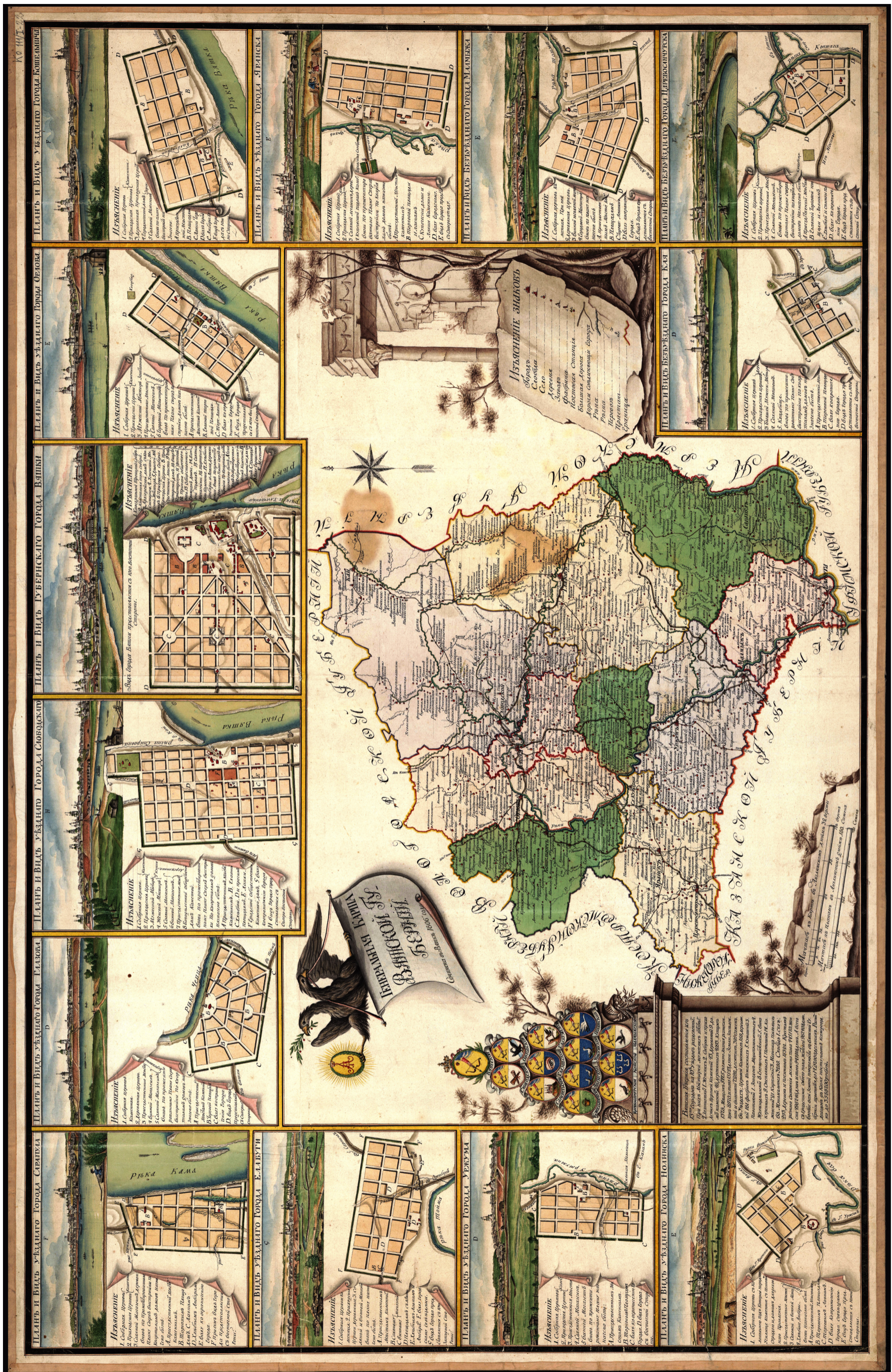
Рис. 17. Генеральная карта Вятской губернии с планами и видами губернского, 9 уездных и 3 безуездных (заштатных) городов 1806 г. Fig. 17. General map of the Vyatka province with plans and views of the provincial, 9 uезд and 3 uезд-less (supernumerary) towns, 1806